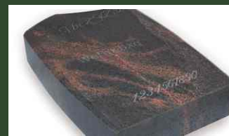
SPOMENIK SA OBORENIM IVICAMA