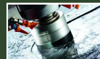
POLIRANJE U PADU